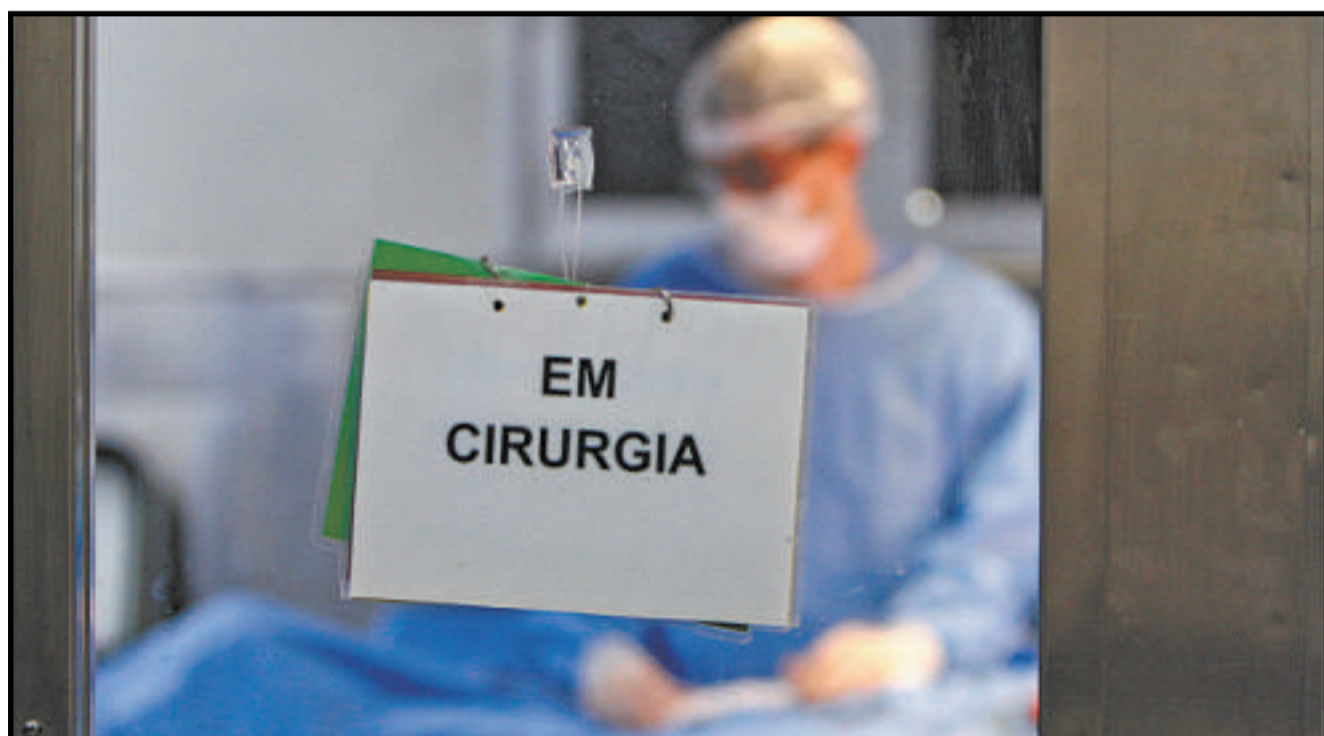
Médico em ação no Centro Cirúrgico, onde leitos de CTI foram abertos depois do incêndio