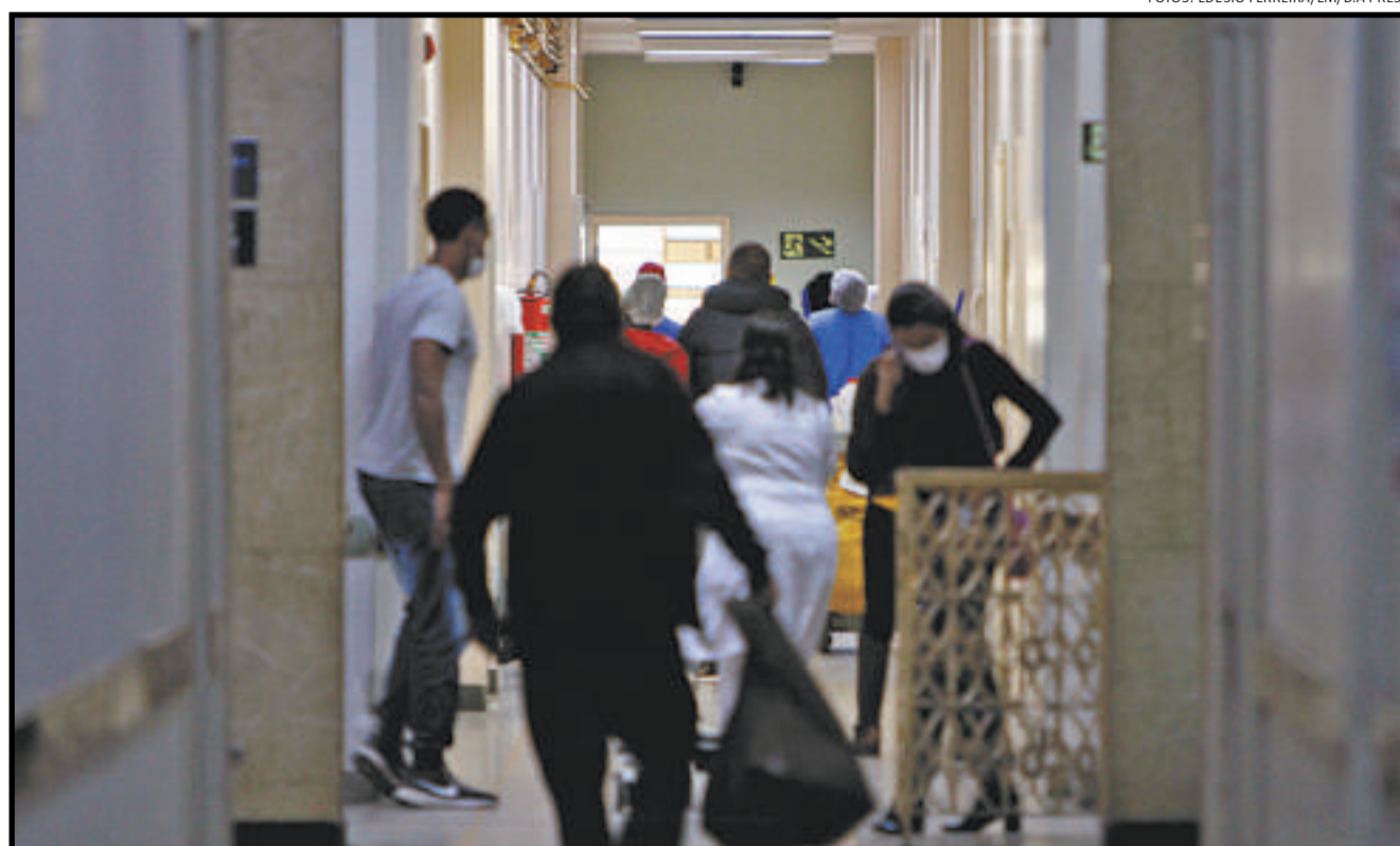
Nos corredores da instituição, profissionais de saúde ou de apoio cruzam com pacientes em constante movimento