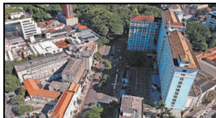
Vista aérea da Santa Casa (D), para onde convergem 15 mil pessoas diariamente em tratamento, a trabalho ou de visita