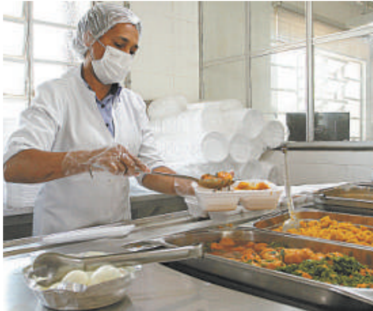
Elaboradas por um chef, 8,5 mil refeições saem da cozinha do hospital diariamente. No Centro Cirúrgico, são 1,1 mil atendimentos mensais